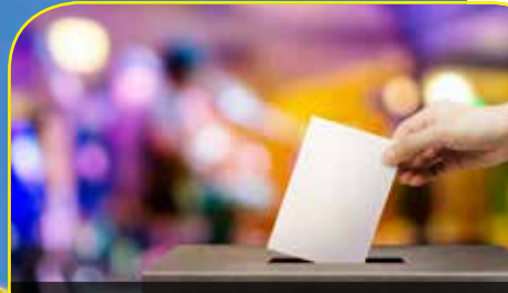
Focus sur les prochaines élections