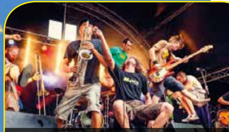
2 e édition de la Fête de la musique