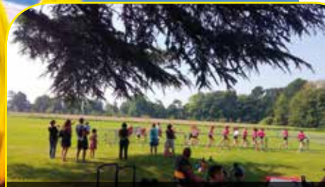
1 re édition de la journée sportive