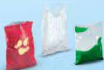
Sacs et sachets