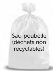
Sac-poubelle (déchets non recyclables)